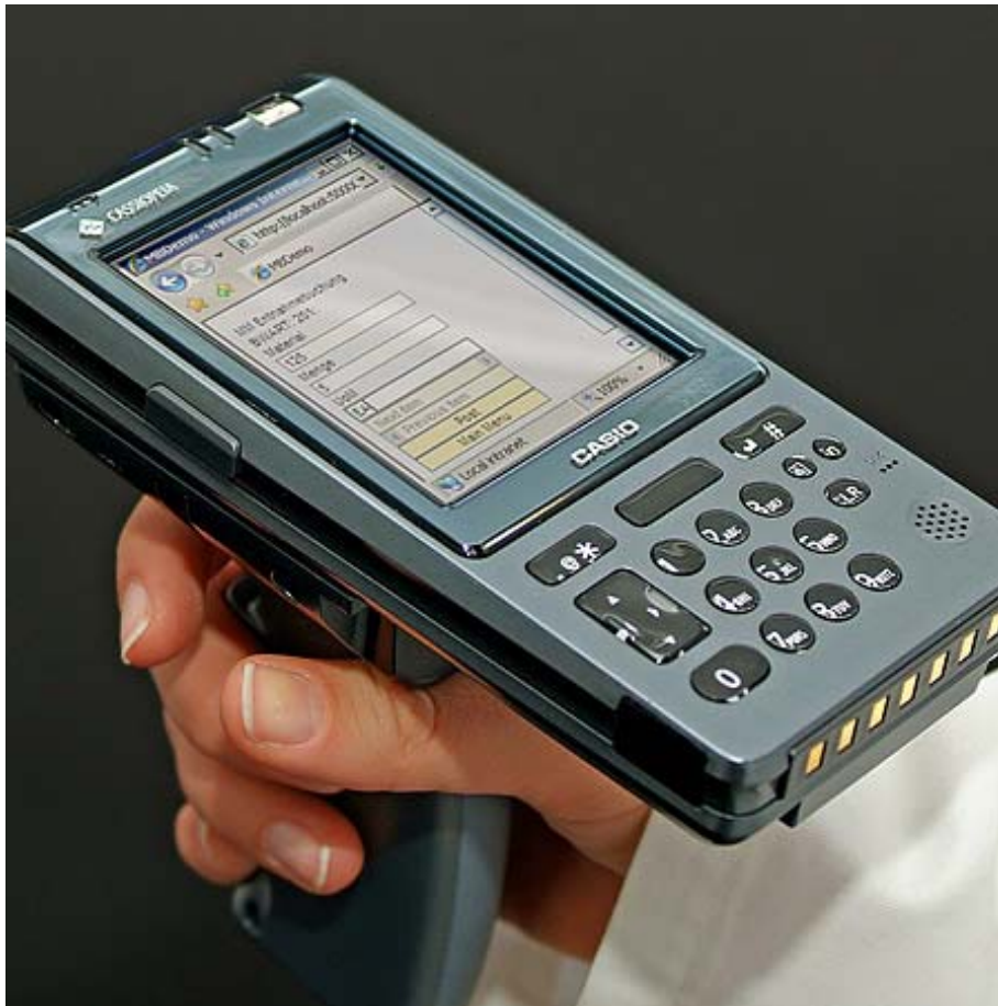
Bild 02: Mobiles Terminal mit Webbrowser bildet SAP Bildschirm ab